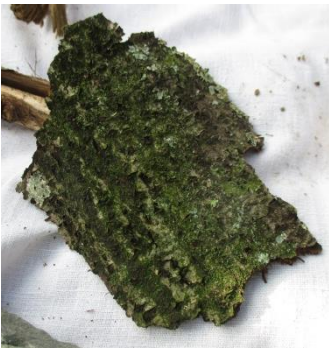
DE L'ECORCE (qui gratte)