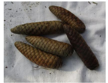
DES POMMES DE PIN