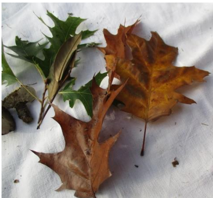
DES FEUILLES – de plein de couleurs et formes différentes)